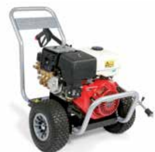
BENZ-C L2021Pi P