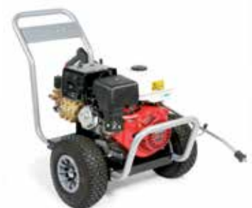
BENZ-C H2013Pi P