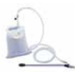
Мешок с песком 50 кг Код PRCH 00065