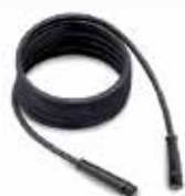
Шланг высокого давления 10 м Код ТВАР 25324