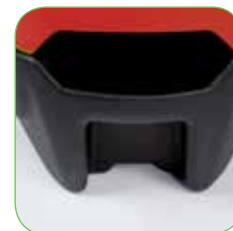
Увеличенная передняя опора для большей устойчивости.