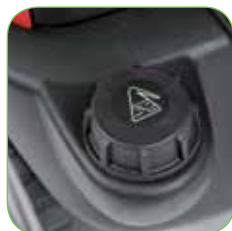
Встроенный бак для мощного средства на 7.5 литра для подачи мощного средства под низким давлением.