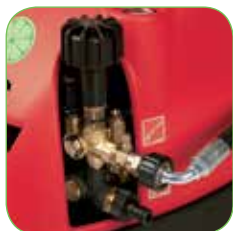
Рукоятка регулировки давления.