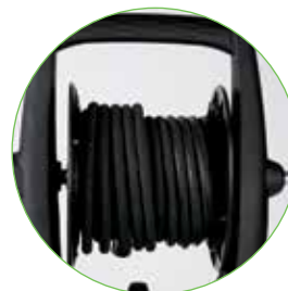
КАТУШКА со шлангом высокого давления 15 м (доступна в моделях Plus)